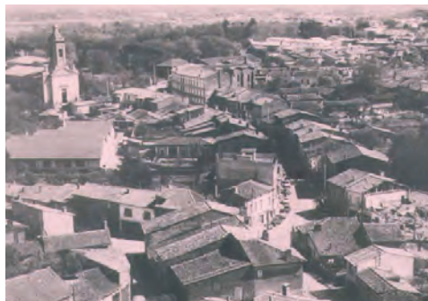
Village en 1967